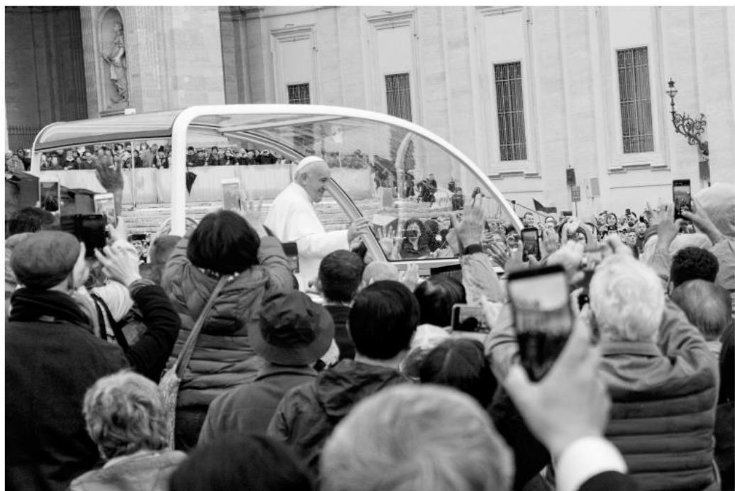
Z generální audience se Svatým otcem ve středu 13. listopadu. Česká národní pouť při příležitosti 30 let od svatořečení Anežky České vrcholí na Svatopetrském náměstí. Několika našim poutníkům se dokonce podařilo osobně se pozdravit s papežem Františkem.