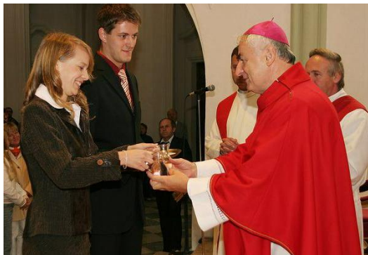
Otec biskup při udělování svátosti biřmování v roce 2008.